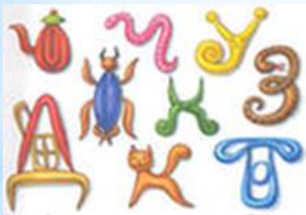
жгуты и жгутики